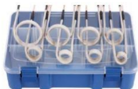
Set dodatnih indukcijskih spiral standardne dolžine. (8 delni) 226,00 €