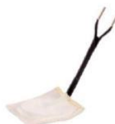
Indukcijska plošča 8 x 8 cm 133,00 €