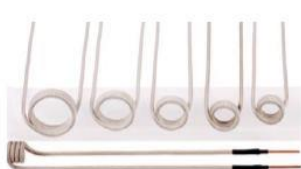
Set podaljšanih dodatnih indukcijskih spiral (6 delni) 246,00 €